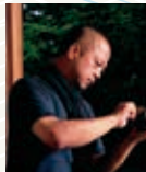
大樋 長左衛門(年雄)